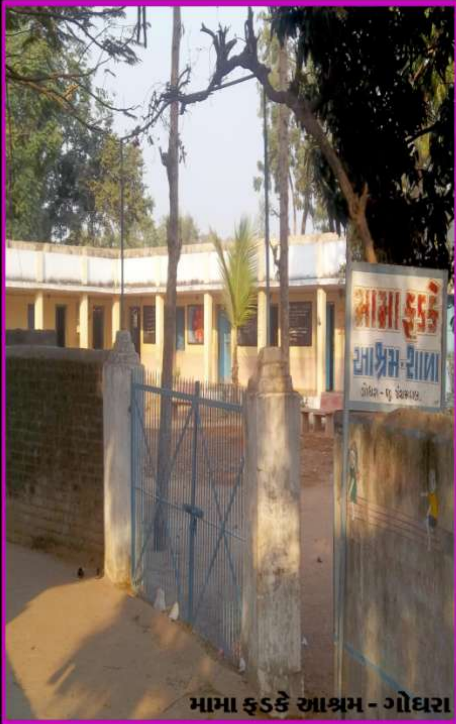
મામા કુસ્કે આશ્રમ - ગોધરા