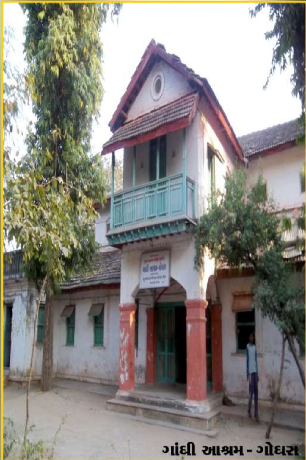
ગાંધી આશ્રમ - ગોધરા